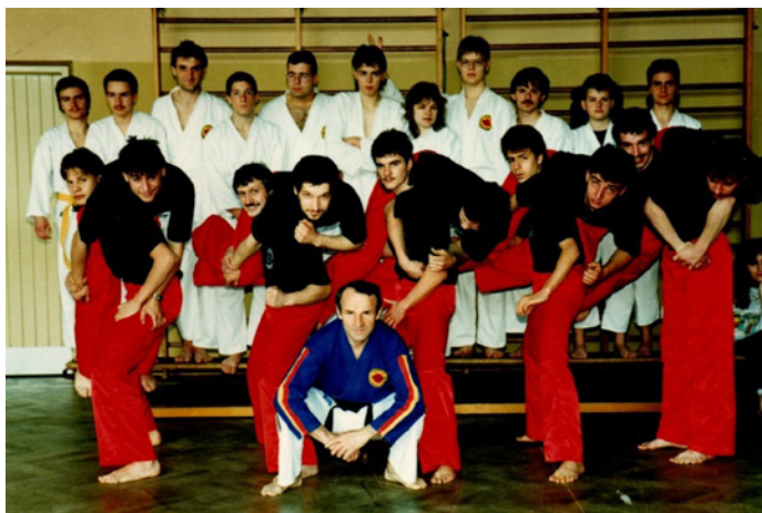
Karate Club Shothkan 1989